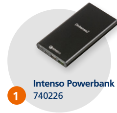
1 Intenso Powerbank 740226