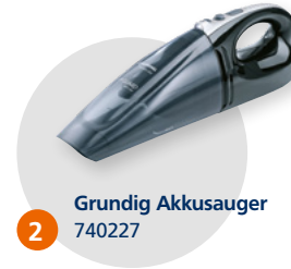
2 Grundig Akkusauger 740227