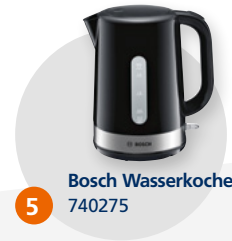
5 Bosch Wasserkocher 740275