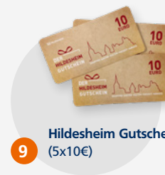
9 Hildesheim Gutscheine (5x10€)