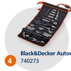
4 Black&Decker Autowerkzeug 740273