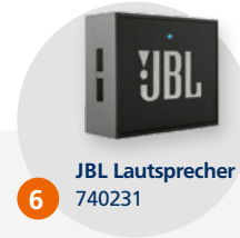
6 JBL Lautsprecher 740231