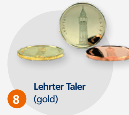
8 Lehrter Taler (gold)