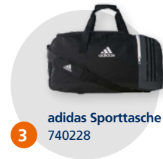
3 adidas Sporttasche 740228